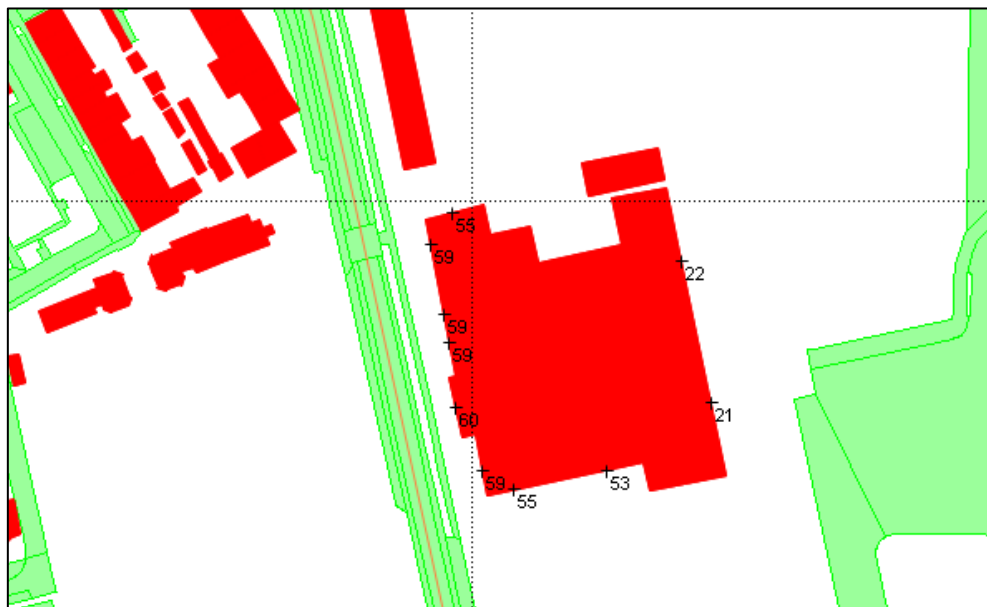
Figuur 3 Berekende geluidbelasting vanwege de Vosdijk

In de navolgende figuur is de berekende geluidbelasting vanwege de Vosdijk weergegeven voor de nieuwe onderwijsinstelling. In bijlage A is een volledig overzicht van de geluidbelastingen in alle rekenpunten weergegeven.