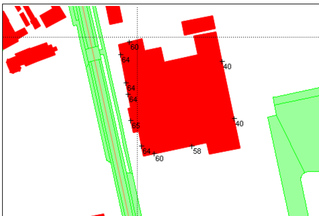
Figuur 4 Berekende gecumuleerde geluidbelasting (inclusief aftrek artikel 110 g Wgh)

In onderstaande figuren zijn de gecumuleerde geluidbelastingen weergegeven zonder maatregelen.