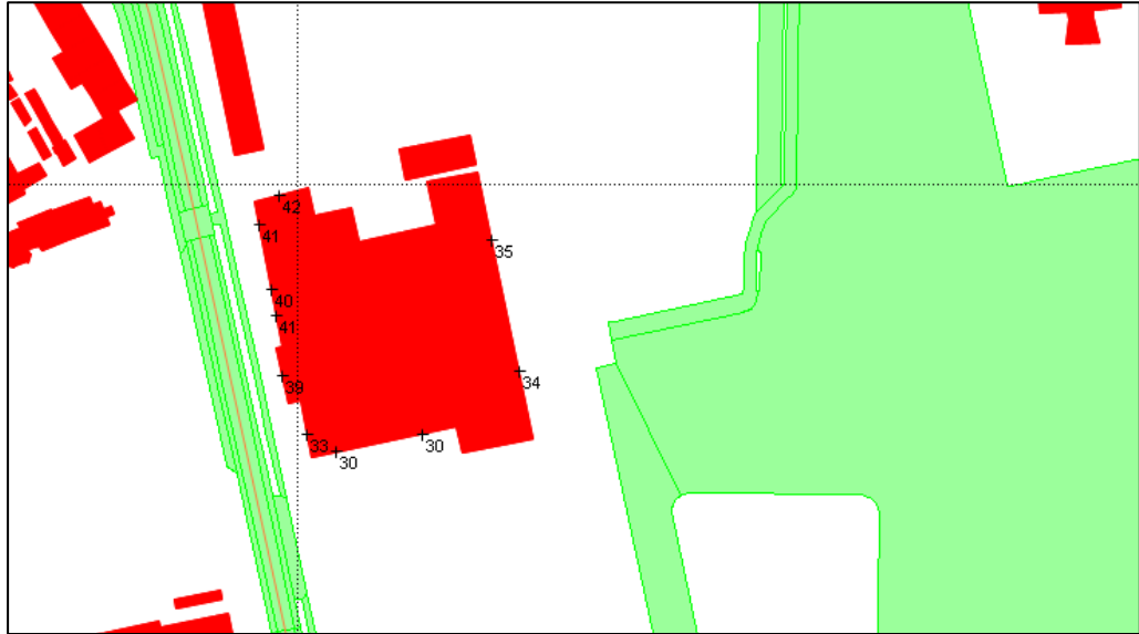
Figuur 2 berekende geluidbelasting vanwege de Velperweg

In de navolgende figuur is de berekende geluidbelasting vanwege de Velperweg weergegeven voor de nieuwe onderwijsinstelling. In bijlage A is een volledig overzicht van de geluidbelastingen in alle rekenpunten weergegeven.