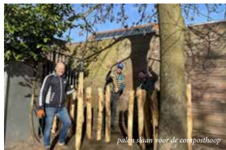
palen staan voor de composthoop

Daar is een ontwerp van gemaakt en in het najaar van 2021 zijn we gestart met de werkzaamheden. Een deel wordt uitgevoerd tijdens gezellige kluszaterdagen met ouders en wijkbewoners.