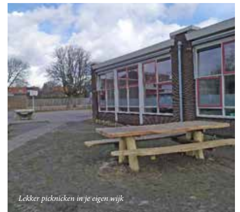
Lekker picknicken in je eigen wijk