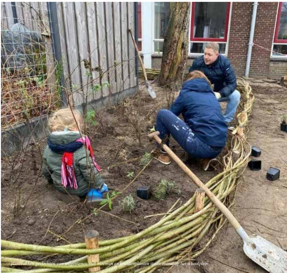
plantvakken gevlochten van wilgentenen met bloemen en kruidenplanten staan overal op het schoolplein

In een groene omgeving kunnen we fijner wonen en bewegen én een groene wijk is beter voorbereid op hitte en wateroverlast. Op het schoolplein van de Jozef Sartoschool spelen veel kinderen uit de wijk. Door alle tegels en weinig beschutting is het op zonnige dagen helaas veel te warm om te spelen en grote plassen water blijven liggen. Goede redenen om eens iets te veranderen aan dit schoolplein.